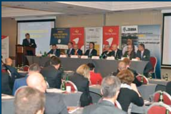
Uczestnicy w trakcie dyskusji panelowej.