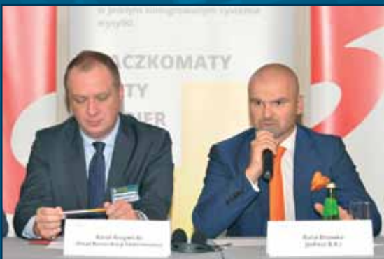
Rafał Brzoska, Założyciel i Właściciel InPost, przekonywał, że głównym źródłem przychodów operatorów w niedalekiej przyszłości będzie obsługa e-commerce.