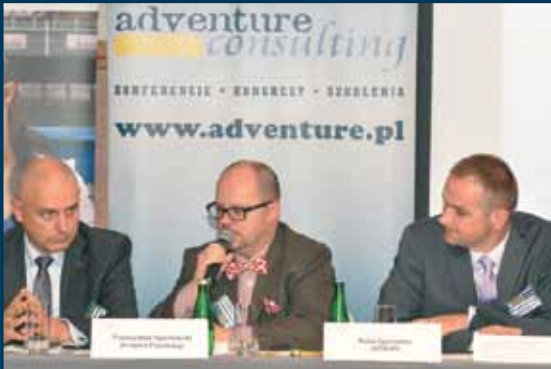
W dyskusji wzięli udział przedstawiciele organizacji branżowych: Polskiego Stowarzyszenia Marketingu SMB, Instytutu Poczтового oraz Ogólnopolskiego Związku Pracodawców Niepublicznych Operatorów Pocztowych.