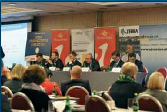
Uczestnicy w trakcie dyskusji.