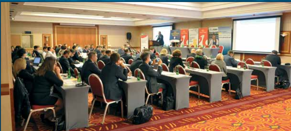
W trakcie obrad konferencji.