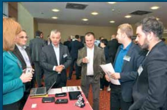
W kuluarach konferencji.